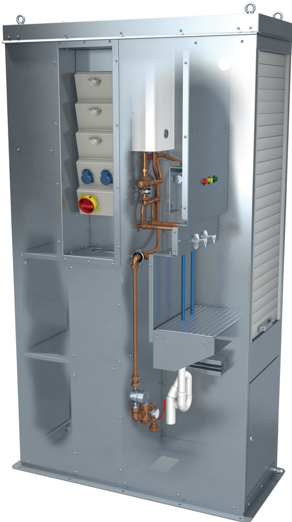
Standard Vogelsang Modello CleanUnit MSV2