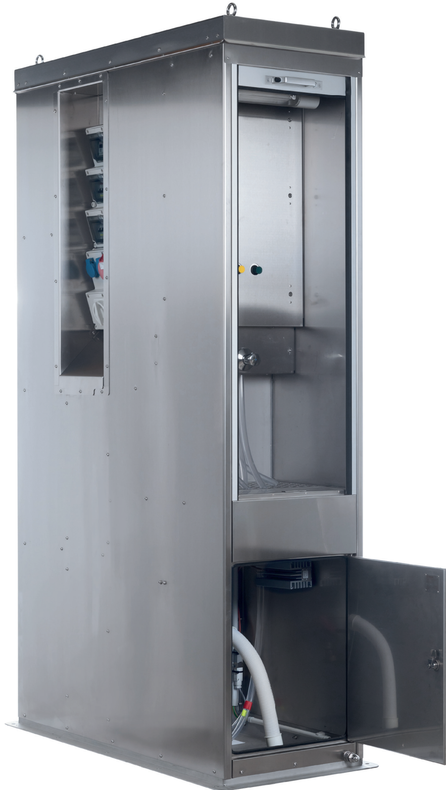
Modello standard Vogelsang CleanUnit MSV2